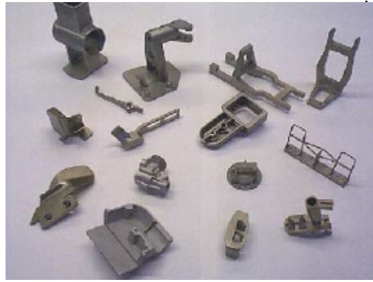
Figuur 7.2 productvoorbeelden gemaakt middels verloren wasgieten (bron: Precisiwerk Zierikzee).

Verloren wasgietwerk heeft een zeer breed toepassingsgebied gevonden: lucht- ruimtevaart, automotive, (fijn)mechanische industrie, wapenindustrie, medische toepassingen en vrijetijdsartikelen.